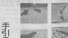
水田放牧の手引き

同商品は、従来の開閉式ホーラーH110P、H70Pをサイズアップした型式で、今まで対応できなかった大型のポット苗[4~4.5号(12~13.5号)]の植え付けが可能となった。また、刃部にはステンレス材を採用、従来品よりも強度が増し、錆びにくくなった。